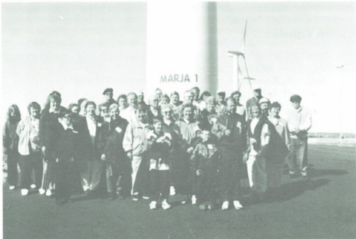
Yhteiskuva retkeläisistä 30.6 1996.