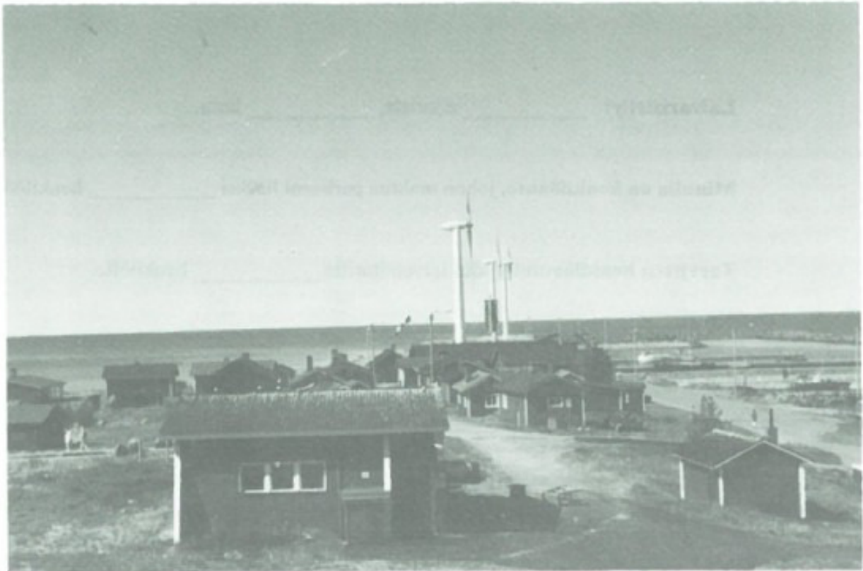
Hailuodon Marjaniemi. Kalastajakylä, jossa tuulivoimalat sijaitsevat.