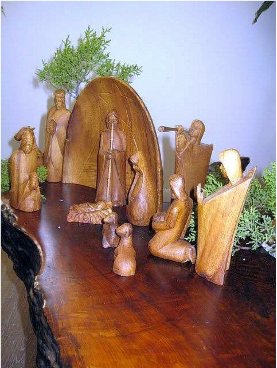
Finnish wood carving creche. Suomalainen puuveistos seimi.